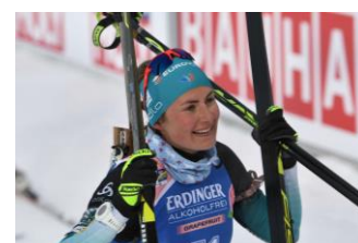
Justine Braisaz Bouchet