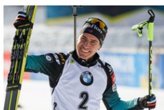
Quentin Fillon Maillet