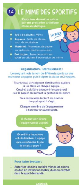
Le mime des sportifs