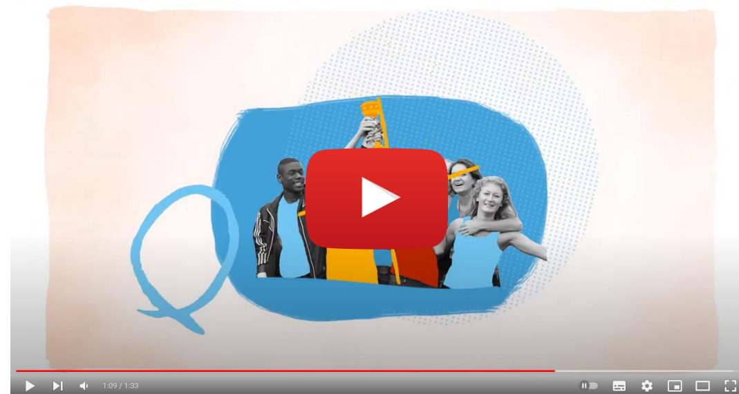
UGSEL - Le sport, c'est que du bonheur !